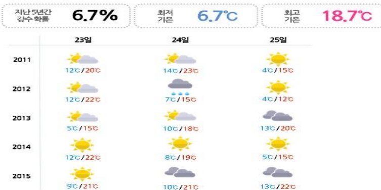
최근 5년간 날씨