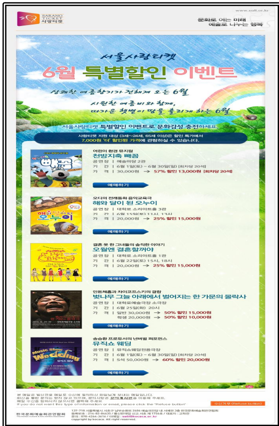
특별할인 이벤트 홍보 이미지