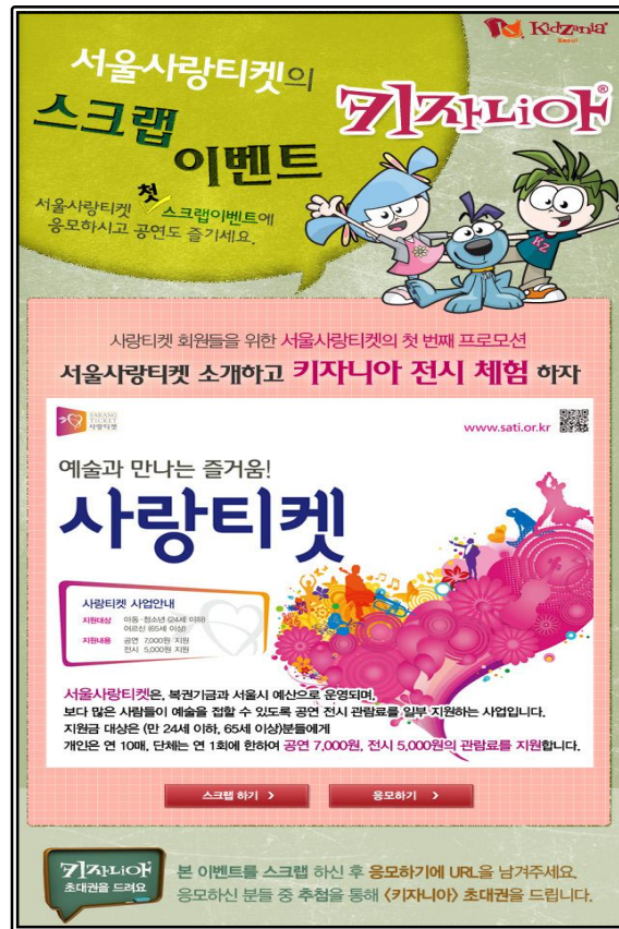
제휴 협력 공동프로모션 이미지