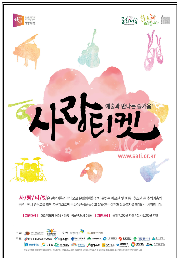
사랑티켓 포스터 이미지