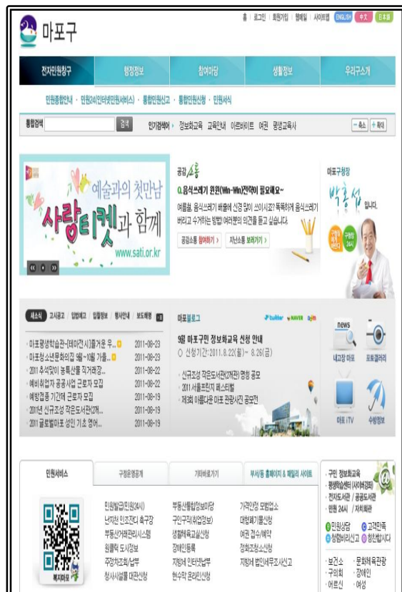
홈페이지 바로가기 배너 이미지