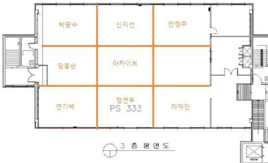
<금천예술공장 3층 PS333>