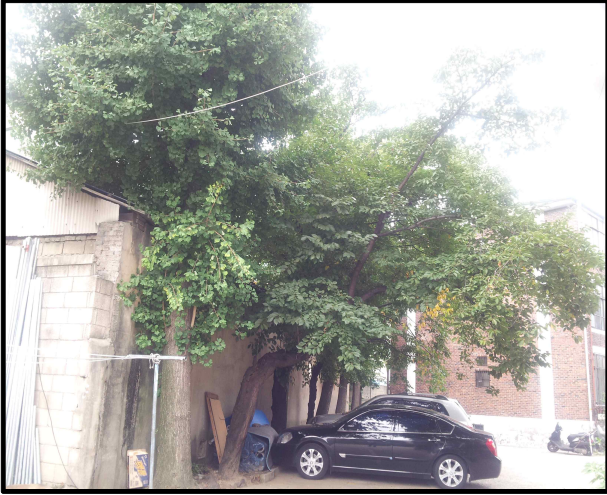
현황 사진 (정안연립 6차 외)