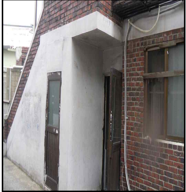
<정안경로당 화장실 전면>