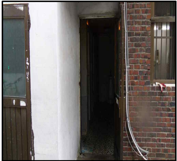
<정안경로당 화장실 내부>