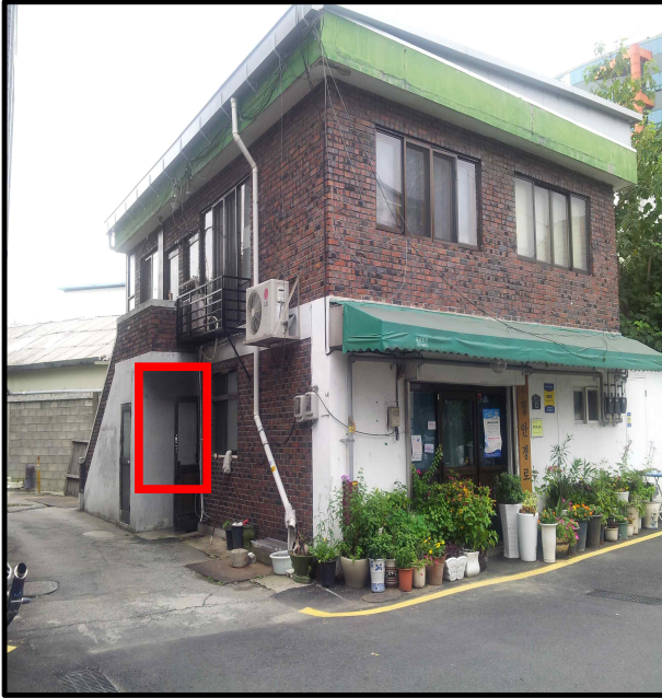
<정안경로당 화장실 전면>