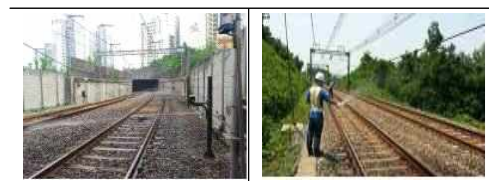
지상 레일 살수 작업