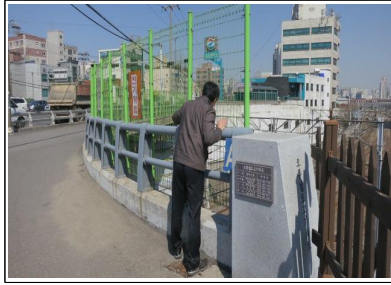
<오류동 현수관로 점검>