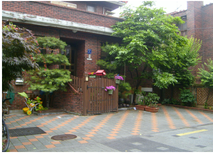
<현재-현관 출입문 주변 목책문 설치>