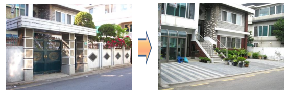
<서대문구 북가좌2동 일대 공사 전→후>