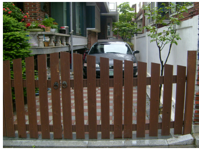
<개선-담장경계에 개폐식 목책문 설치>