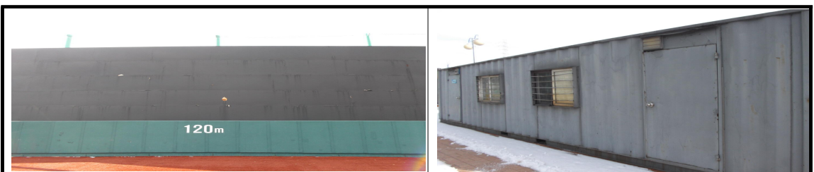
백 스크린 및 컨테이너 도색