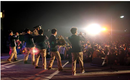
〈색소폰 밴드 공연〉