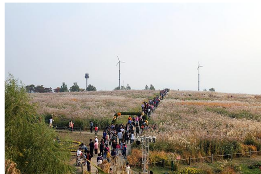
〈2013년 제12회 서울 억새축제 현장〉