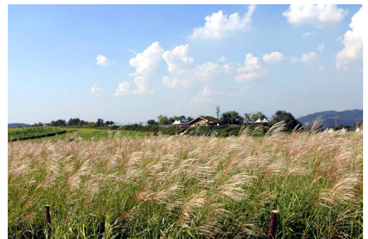
〈활짝 핀 억새꽃〉