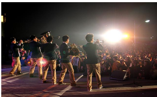
〈색소폰 밴드 공연〉