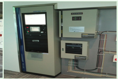
자동화재탐지 설비 등