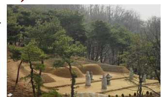
광릉부원군 이극배 묘역