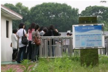
우리시 신규임용자 현장견학