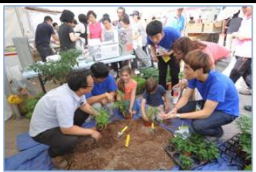
< 텃밭 가꾸기 체험 >