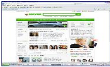
▶ 포털사이트 홍보