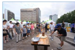
< 떡 메치기 체험 >