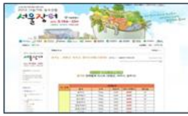
▶ 블로그 메인화면