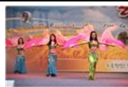
< 밸리댄스 >