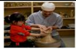
<전통도자기 물레 체험>