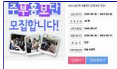
▶ 주부 홍보단 모집