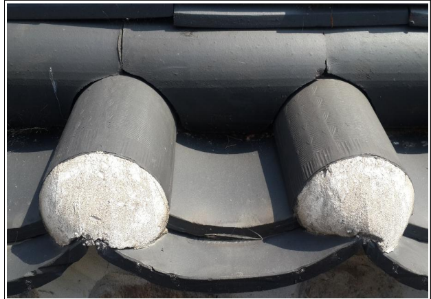
담장 주변 거미줄 제거