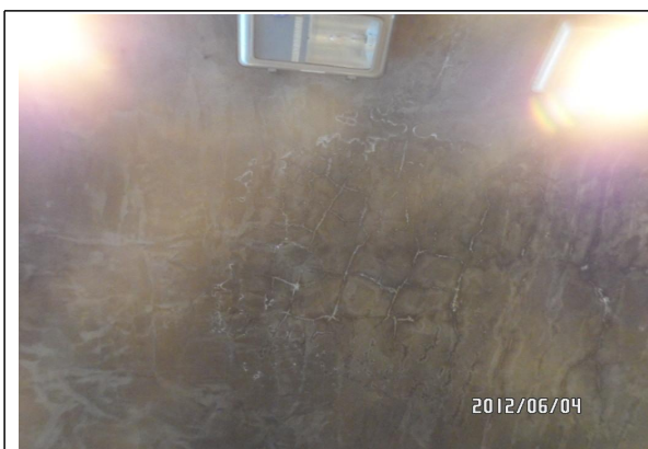
고척2지하차도 백태 망상균열