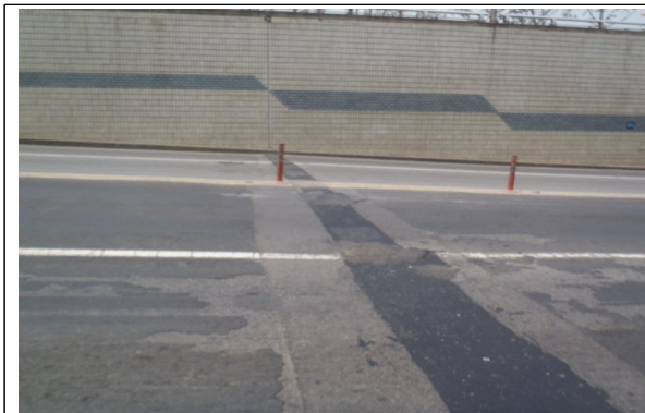
개화지하차도 포장체 파손