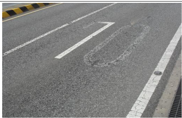
외발산지하차도 포장체 파손