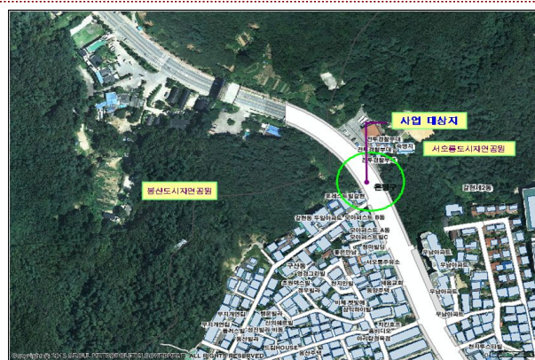
서오능고개(봉산 - 앵봉산간)