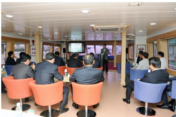
▶ 전국 시·도의회 운영위원장 한강현장시찰(09.07)