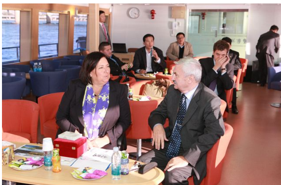
▶ 폴란드 대통령 영부인 한강현장시찰(10.23)