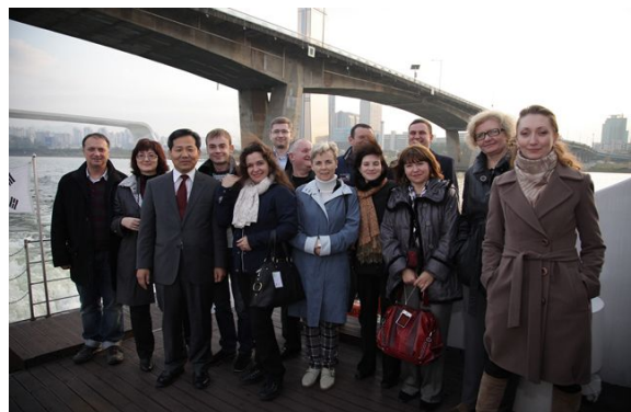
▶ 우크라이나 전자정부공무원 한강현장방문(11.07)