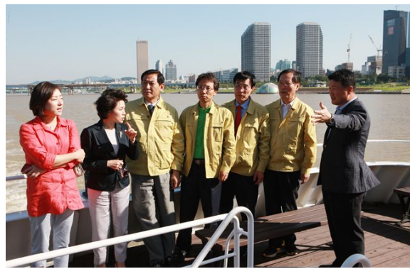
▶ 시의회 환경수자원위원회 현장시찰(09.06)