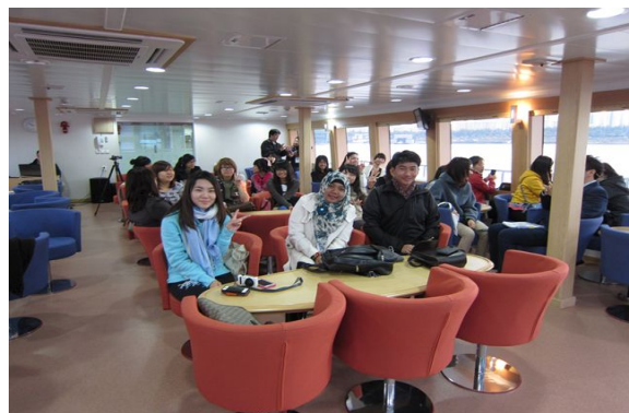
▶ 아시아파워블로거 한강캠투어(10.24)