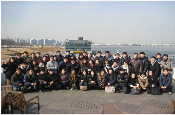
▶ 인재개발원 신임리더과정 한강현장방문(02.10)