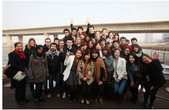
▶ 프랑스 파리공과대학 한강현장방문(03.17)