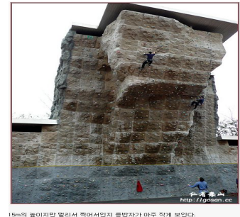
15m의 높이지만 멀리서 찍어서인지 용반자가 아주 작게 보인다.