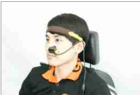
안구마우스 eyeCan (헤어밴드 타입)