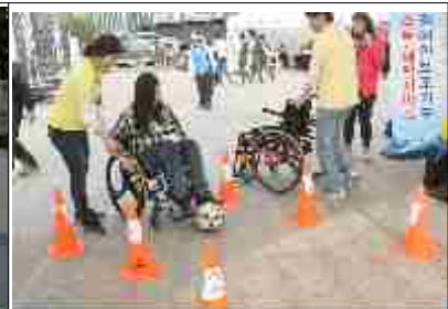
장애인 누리축제 홍보