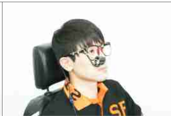
안구마우스 eyeCan (안경 타입)