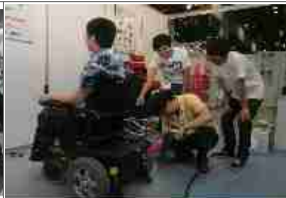
보조기구 전시 및 체험