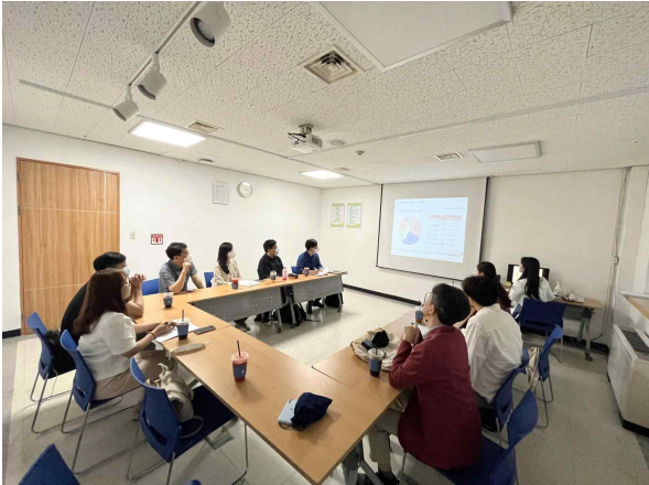
2023년 5월 질 관리 회의