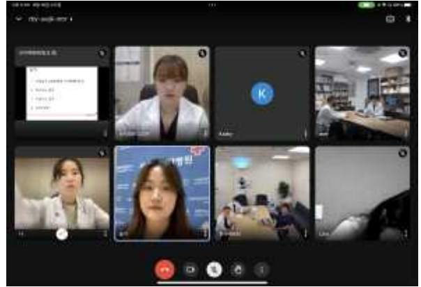
2023년 8월 질 관리 회의