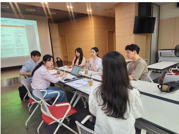
2023년 7월 상담사 간담회