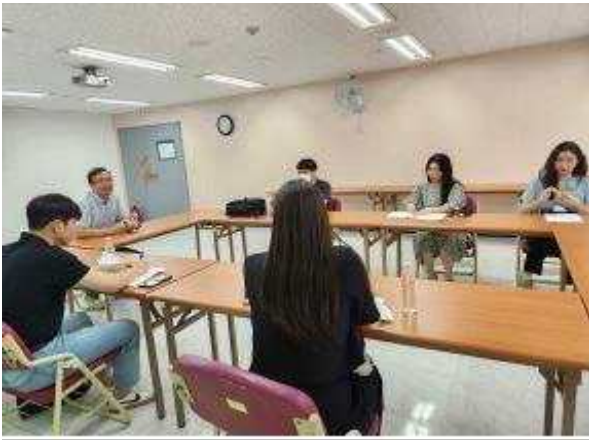
유관기관 방문 및 간담회 (비전트레이닝센터)