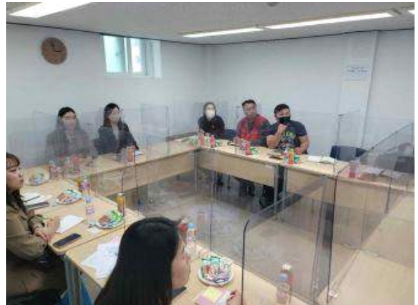
유관기관 방문 및 간담회 (브릿지 종합지원센터)