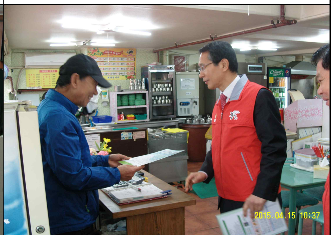
『명동』 쓰레기 감량 실천단