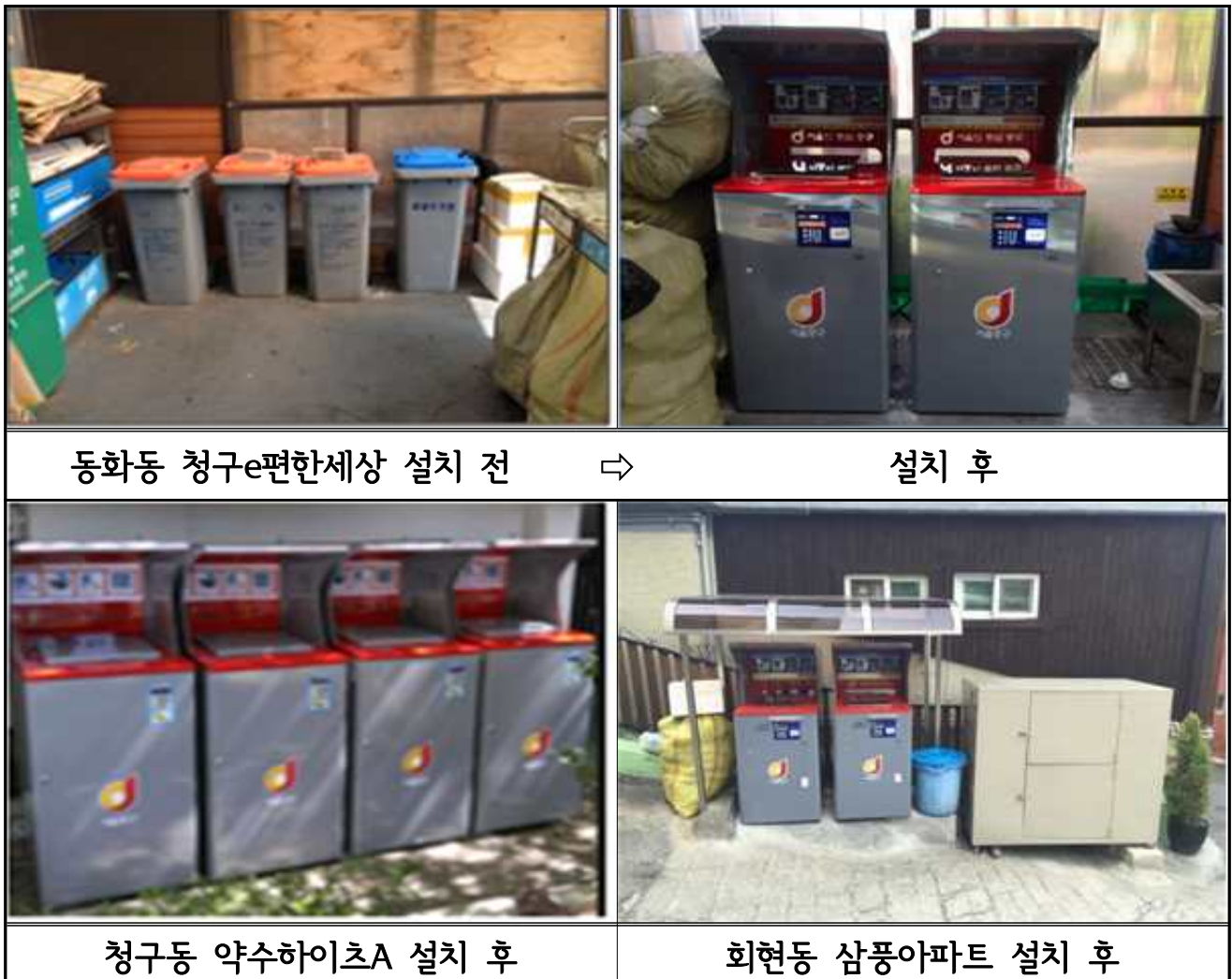
동화동 청구e편한세상 설치 전