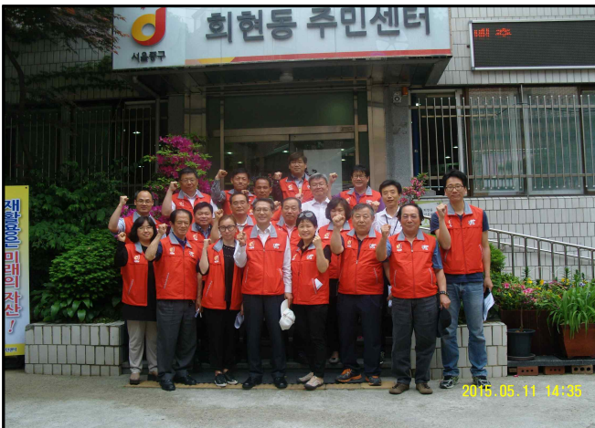
『회현동』 쓰레기 감량 실천단