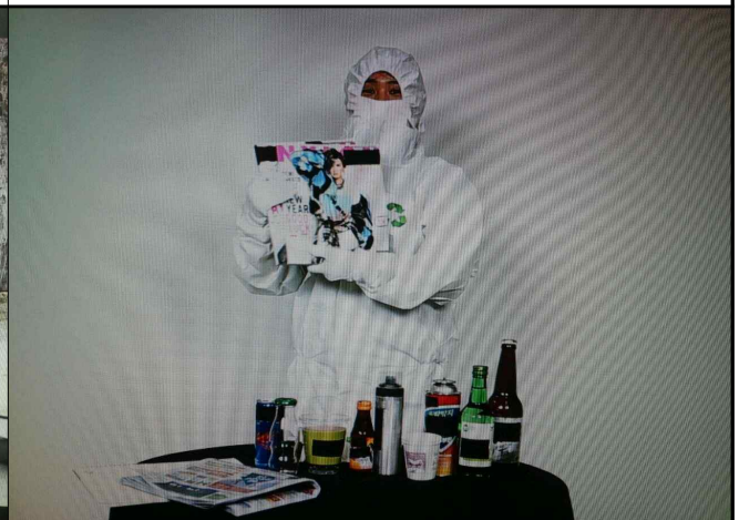
“재활용품 선별법”편 방송화면