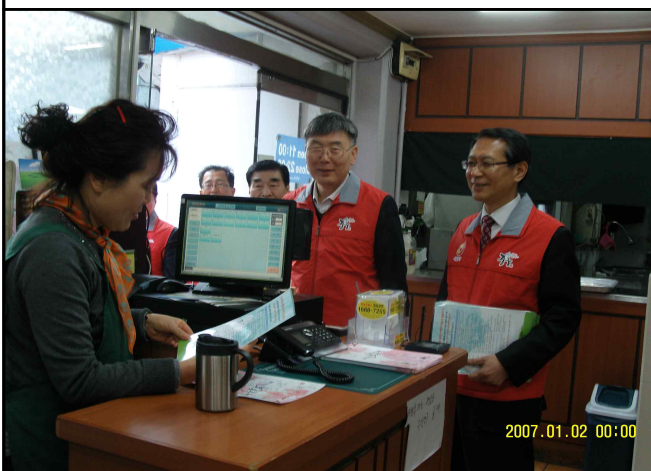
『필동』 쓰레기 감량 실천단