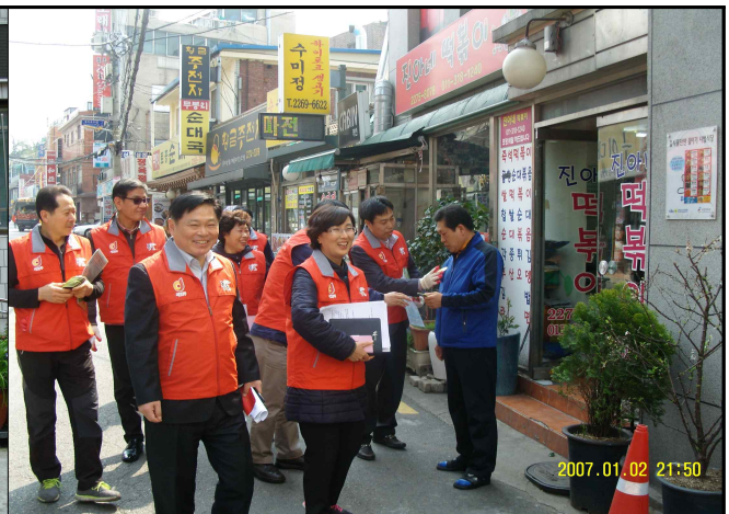
『장충동』 쓰레기 감량 실천단