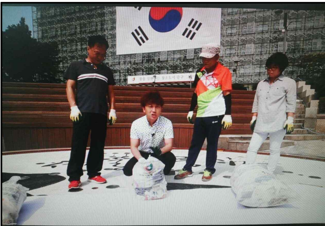
“종량제봉투 파봉”편 방송화면 ①