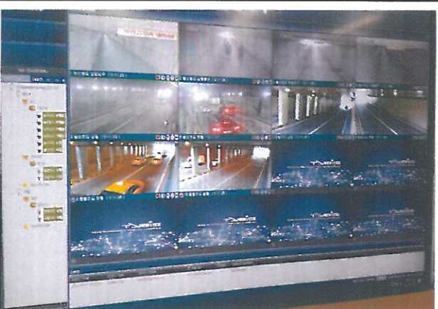
연번3: 신내지하차도 CCTV 화면미표출