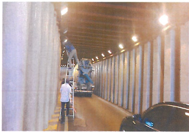
연번1: 성동지하차도 터널등 부점등