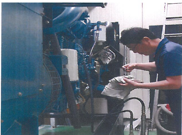
연번2: 중랑지하차도 배수펌프 기동점검