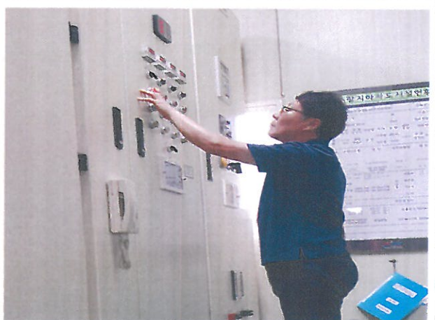
중랑지하차도 발전기 점검