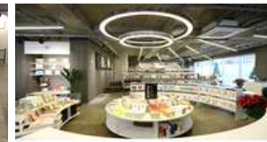
▲ 카페 창비_동선을 고려한 서가