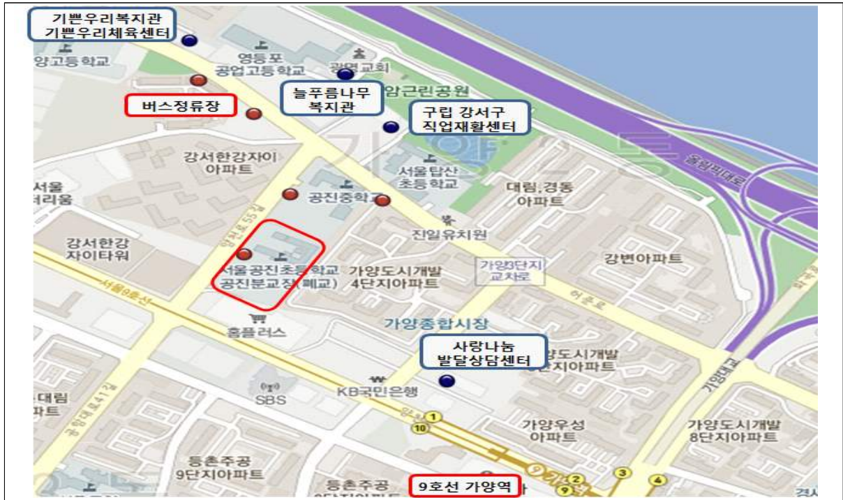
[표-4] 공진초 이적지 주변 장애교육시설 현황