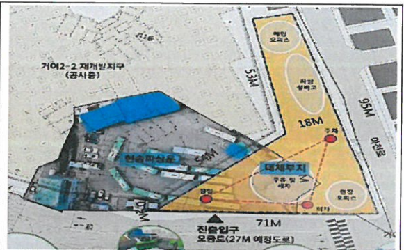
< 협의안 : 약2,500㎡ 이상 >