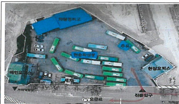
< 현재 : 3,278㎡, 34~42대 사용 >

재개발조합과 송파상운이 재개발지구내에 임시차고지를 32개월간 약2,500㎡ 이상 사용하는 안을 합의