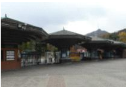
동물원 정문 현황