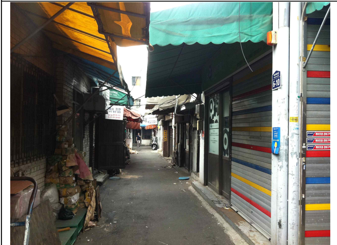
인쇄소 및 가공분야 밀집구역 (6-2구역)