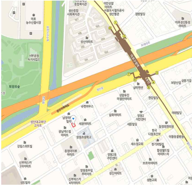
<위 치 도>