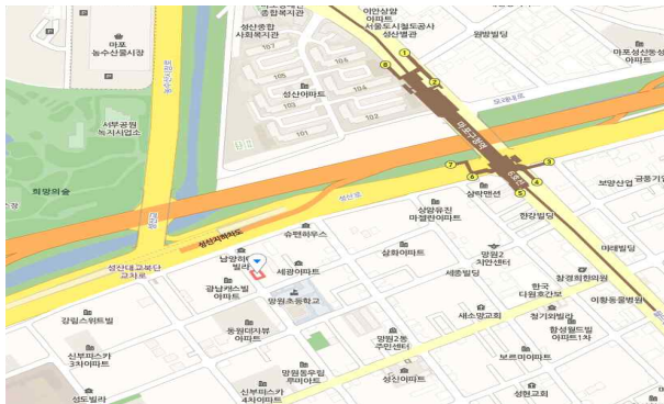
<위 치 도>