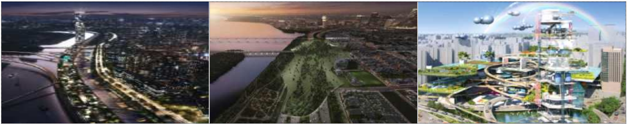
〈인프라공간 복합개발 아이디어구상안 사례〉