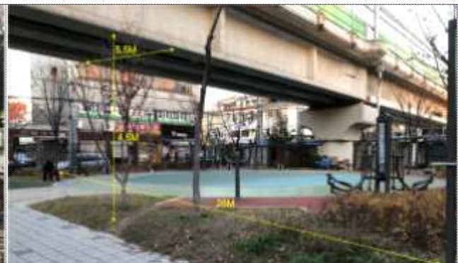
중랑천 고가하부공간 현황사진

➔ 2019년 고가하부공간 활용사업 6개소 완료를 통해 공공문화 네트워크 구축