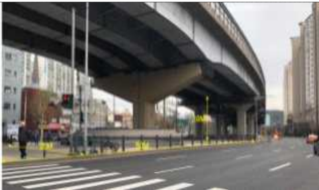
종암사거리 고가하부공간 현황사진