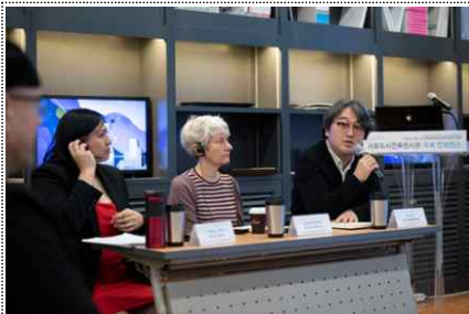
< 1부 >