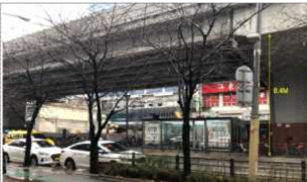
금천 고가하부공간 현황사진

➔ 2차 사업인 금천구, 중랑구 고가하부 활용사업의 공모를 통한 설계자 선정