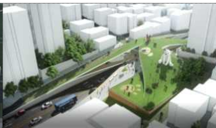
최우수상 : 효령로 고기상부