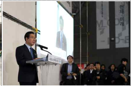
< 개관식 >