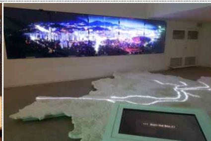
< 서울의 현재 >