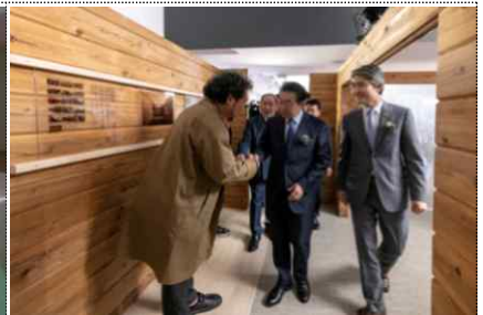
< 서울의 미래 >