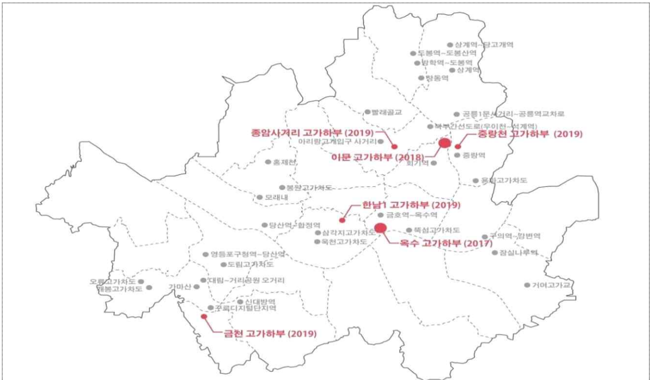
모델1호 옥수 고가하부(성동구)