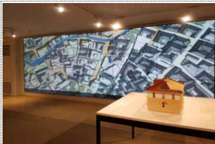
< 서울의 과거 >