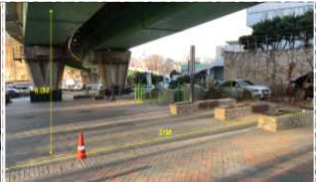
한남1 고가하부공간 현황사진