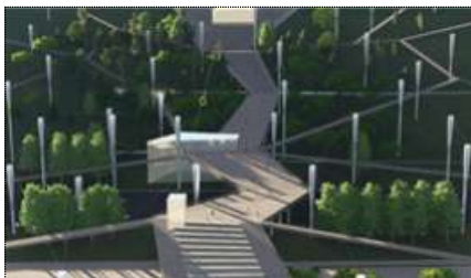
대상 : 강변북로-하늘공원