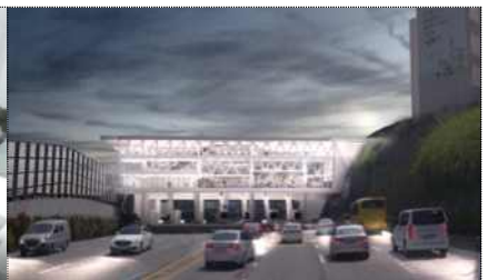
최우수상 : 남산1호터널 요금소상부