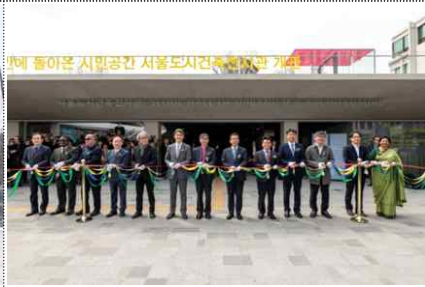
< 테이프 커팅식 >