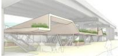
모델3호 종암사거리 고가하부(성북구)