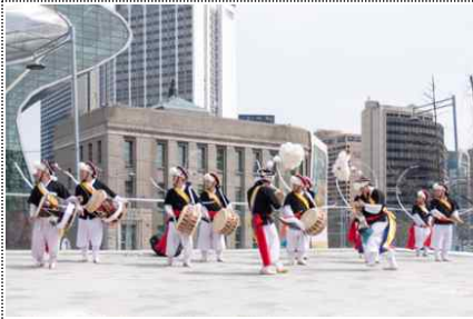
< 오프닝 공연 >