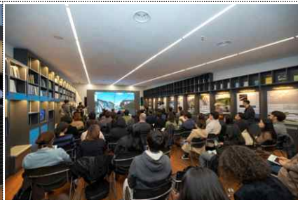
< 2부 >