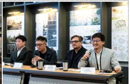
< 3부 >