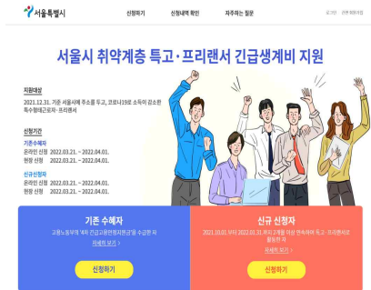
〈신청 홈페이지 메인화면(안)〉