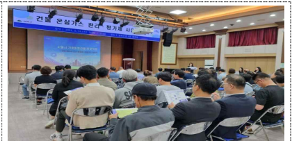
5.16.(강북구청 대강당, 100여명)