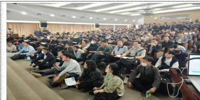
5.8.(서소문청사 후생동, 500여명)