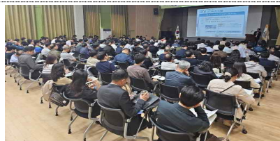
5.13.(서초구청 대강당, 180여명)