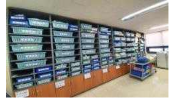
< 학습준비물센터 >