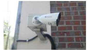
< CCTV 교체 >