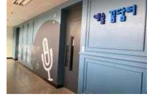
< 문화예술특별교실 >