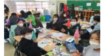
< 마을강사 연계 수업 >