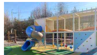
< 꿈을 담은 놀이터 >