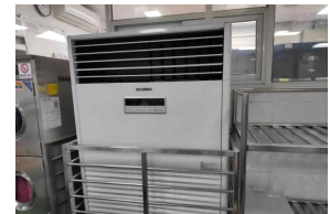
< 노후급식시설 개보수 >