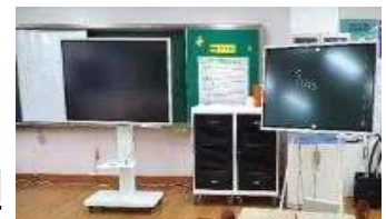
< 미래형교실 구축 >