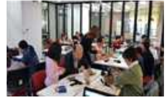
< 마을결합형도서관 >