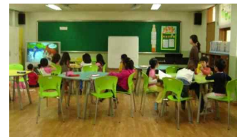
< 온종일돌봄교실 >