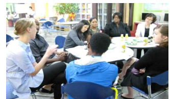
< 원어민보조교사배치 >