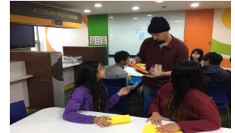
< 서울 영어·창의마을 >