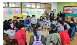
< 서울형 혁신학교 >