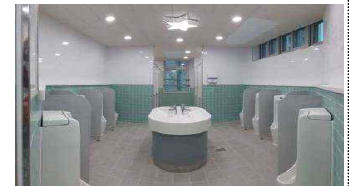
< 학교화장실리모델링 >