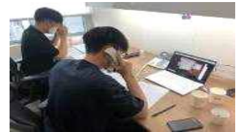
< 창의아이디어 경진대회 >