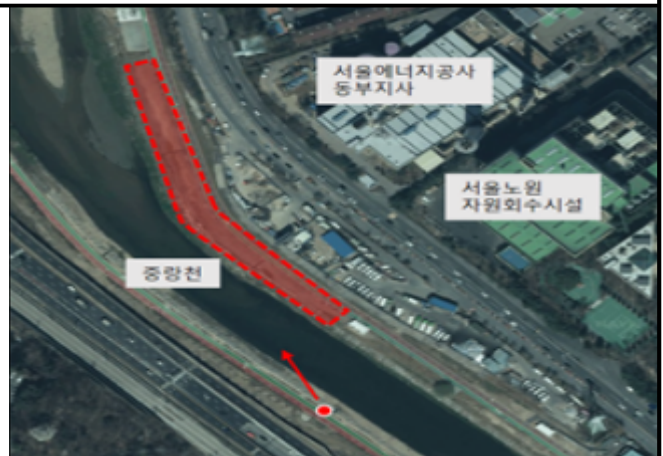
당현4교~녹천교 사이(보안등 설치)