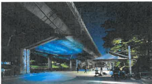
<홍제천-사천교 하부 고보조명>