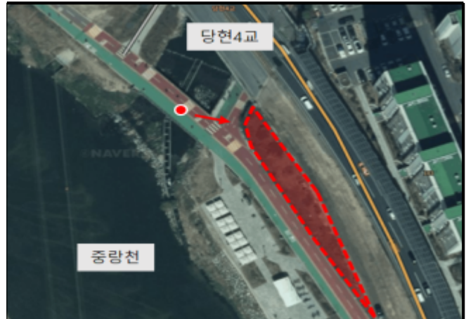
당현4교 인근(라인조명 설치)