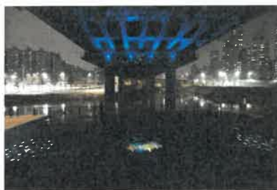
<안양천-신정교 하부 고보조명>