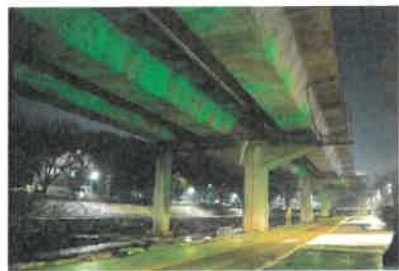
<홍제천-내부순환로 측면 고보조명>