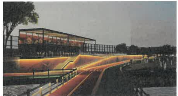
<중랑천 - 만남의 광장 휴게쉼터 라인조명>