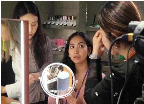
&lt; K뷰티 메이크업 체험 &gt;