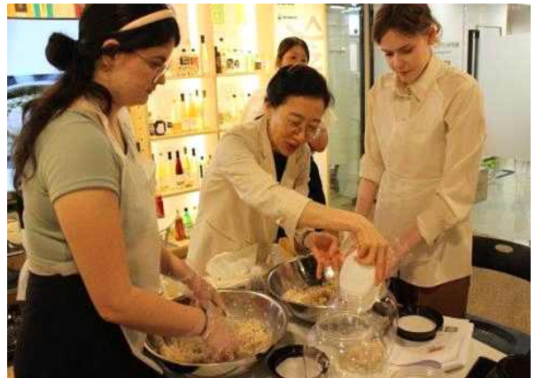
&lt; 전통주 체험 &gt;