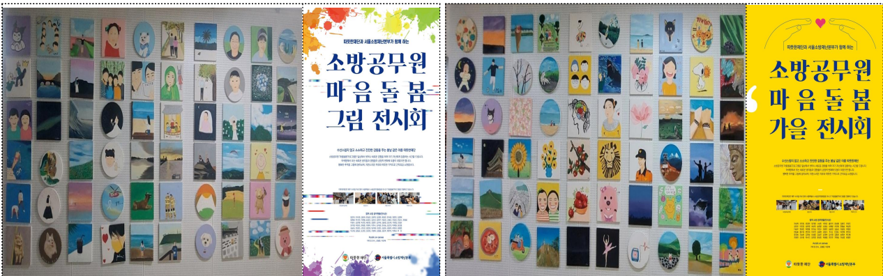
(1차) 마음돌봄 그림 전시회(10개 기관 61점)