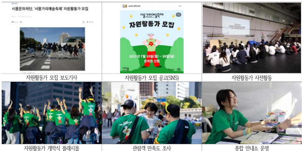
자원활동가 모집 보도기사