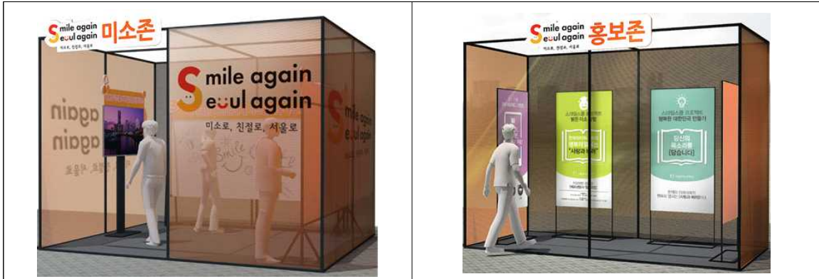
부스 시안(3m X 3m X 2.4m/미소존 기준)