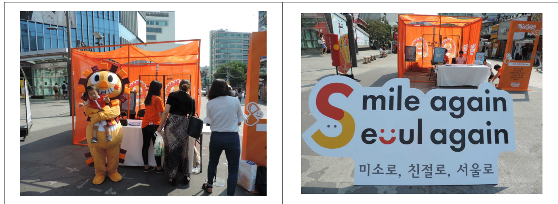
실제 행사 사진(구성에 따라 다름)