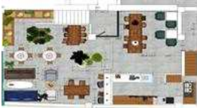
공유형상점(녹원) 컨셉디자인(주거환경학과 협조)