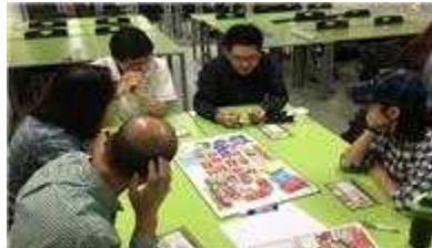
창업 기초반 수업 현장