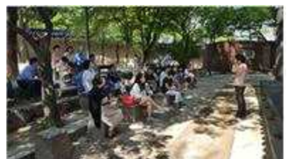
해설사 & 도슨트 야외 수업