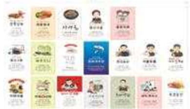
< 용문전통시장 상인 명함제작 >