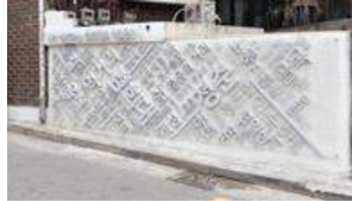
숨,프로젝트 노후화된 벽면 개선 작업