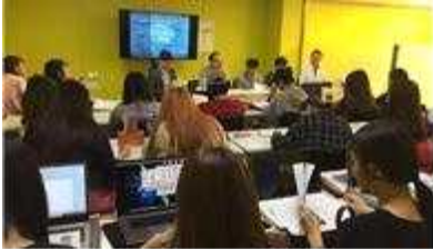
< 캡스톤디자인* 수업 진행 >