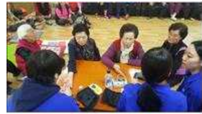
재학생 재능나눔 사업