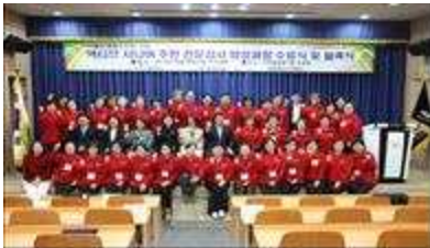
액티브 시니어 주민 전문강사단 발족