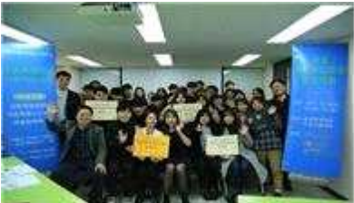
소셜 크라우드펀딩 경진대회