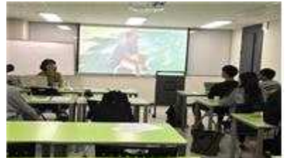
촬영된 다큐멘터리 상영과 평가