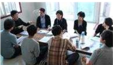
청년 예술작가 아이디어 회의