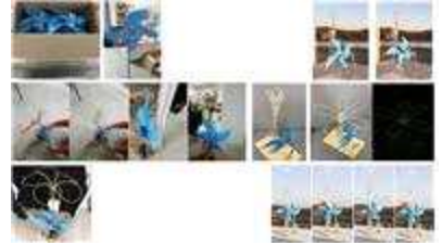
< 키네틱아트** 공작소 운영 >

*캡스톤디자인(창의적 종합설계):문제를 해결할 능력을 키우기 위해 작품을 기획하거나 설계, 제작을 논문대신으로 하는 교육과정 **키네틱아트 : 움직임을 중시하거나 그것을 주요요소로 하는 예술 작품/ 작품 그 자체가 움직이거나 또는 움직이는 부분이 조립된 것