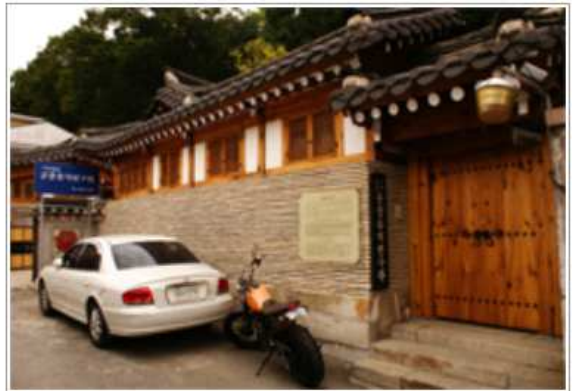
개·보수 지원 후