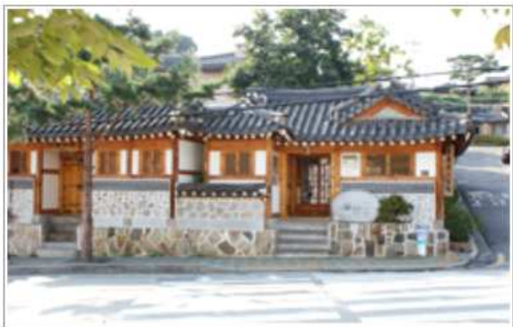
개·보수 지원 후