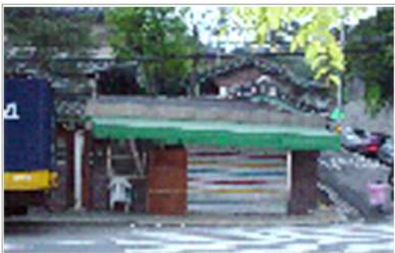
개·보수 지원 전