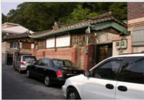
개·보수 지원 전