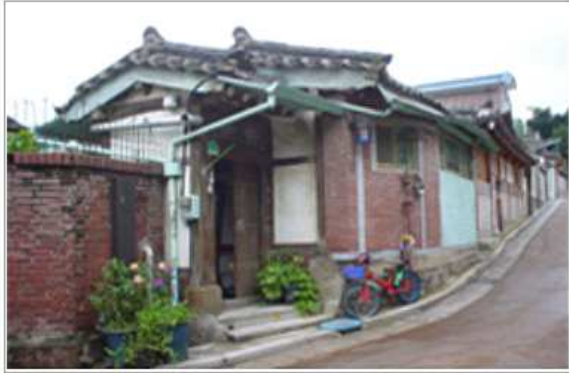
개·보수 지원 전