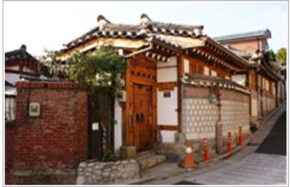
개·보수 지원 후