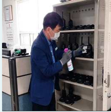
휴대용 무전기 소독