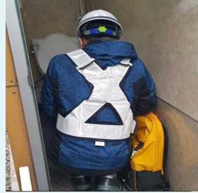
간이화장실 소독(주 1회)