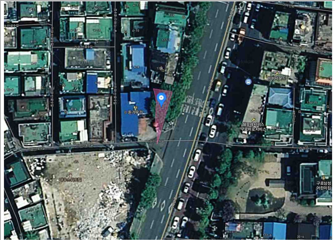
구로동 403-5 마을마당