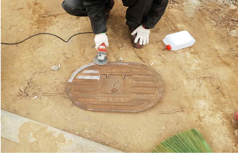
상수도 계량기 맨홀 녹제거