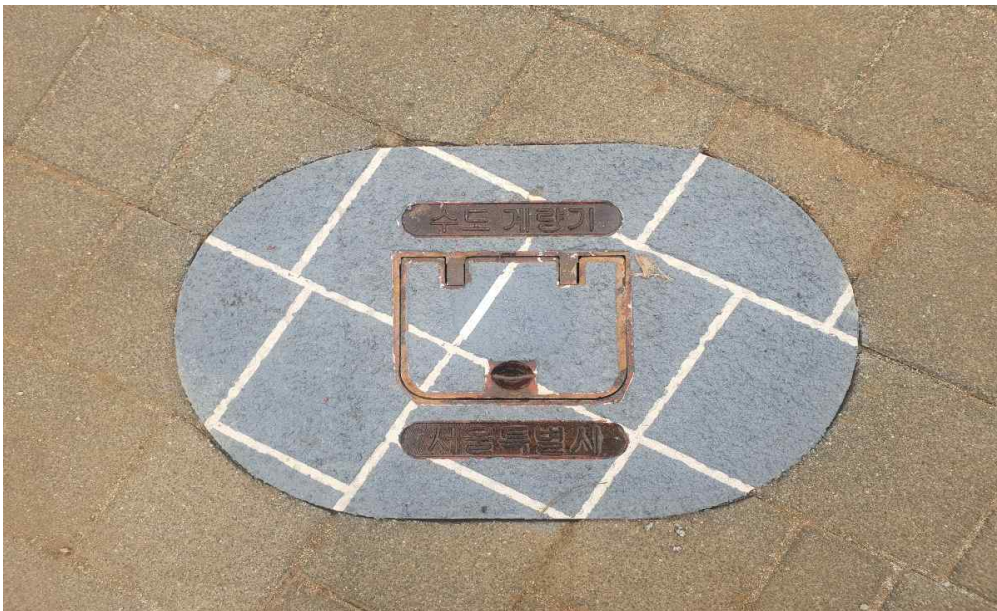
상수도 계량기 맨홀 MMA 작업 완료