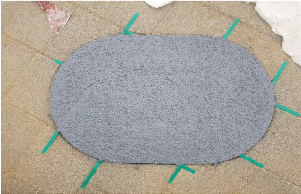
상수도 계량기 맨홀 MMA 2차 도포