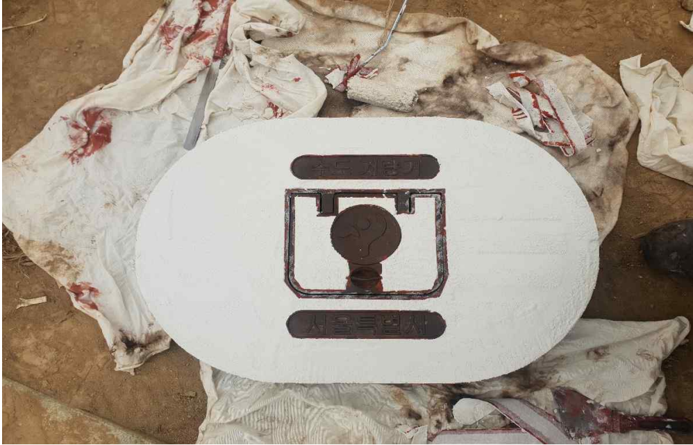
상수도 계량기 맨홀 1차 BASE 도포 완료