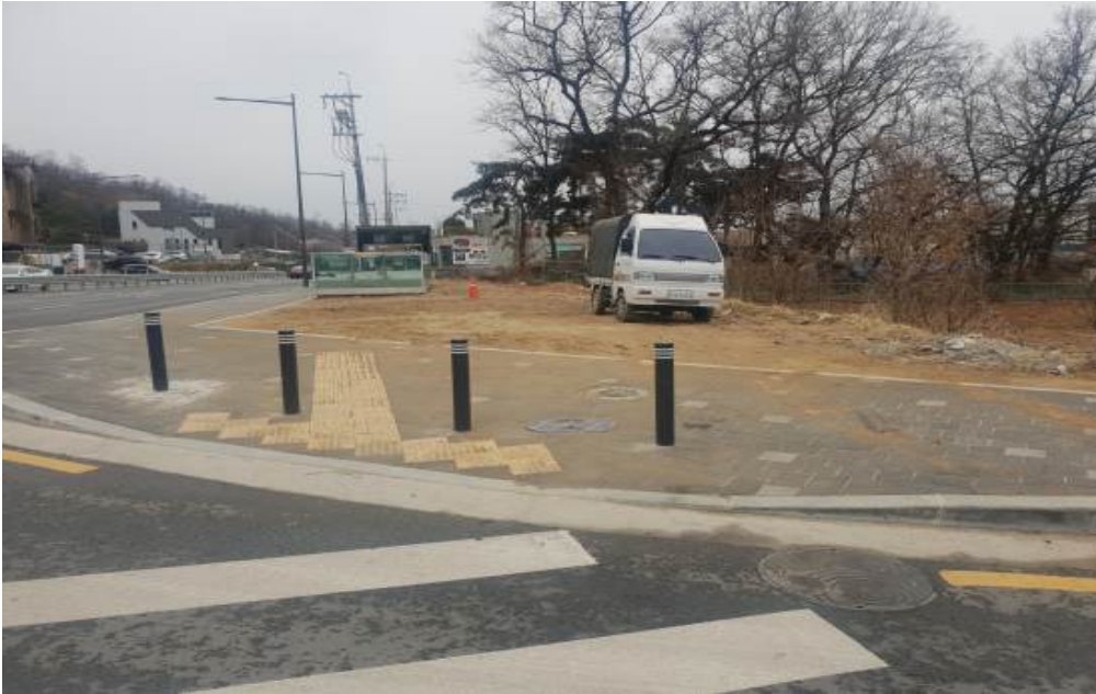
상수도 계량기 맨홀 MMA 코팅후 전경