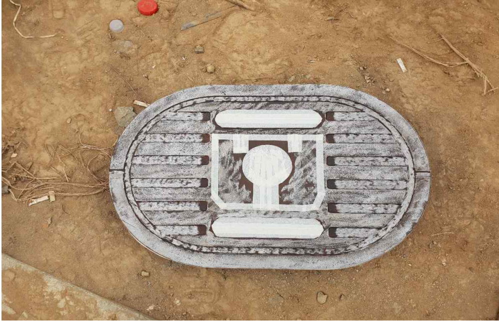
상수도 계량기 맨홀 마스킹 테이프 설치