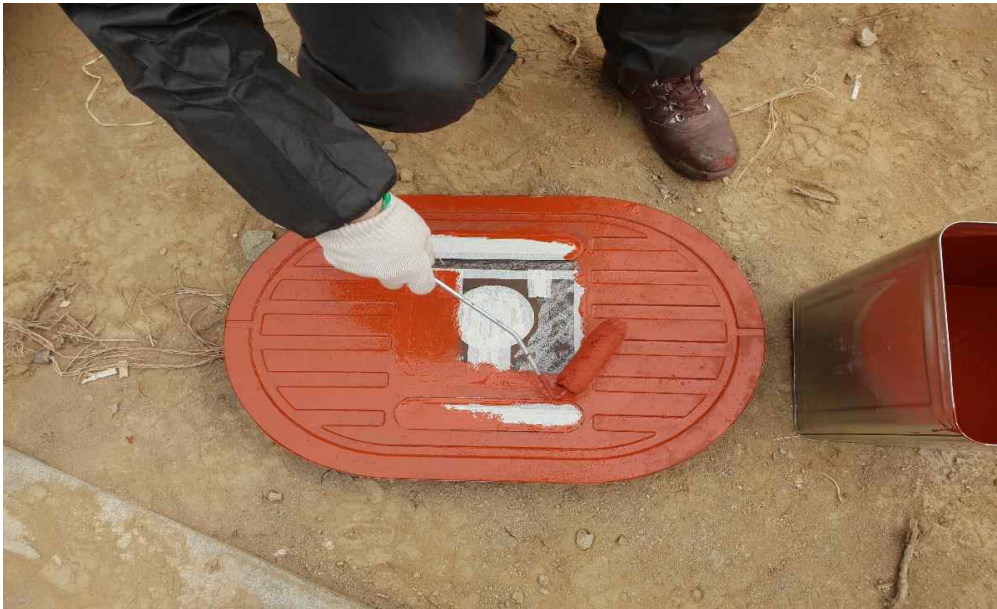
상수도 계량기 맨홀 프라이머 도포