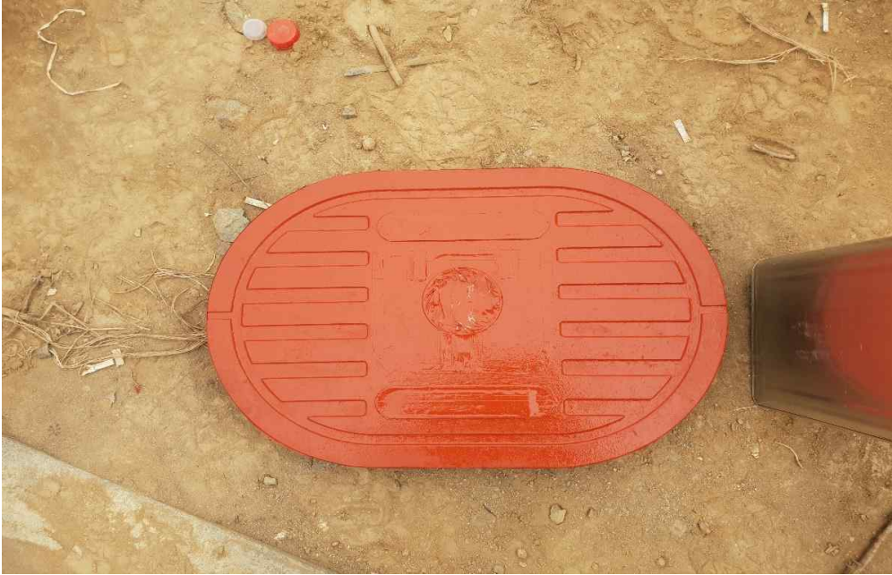
상수도 계량기 맨홀 프라이머 도포 완료