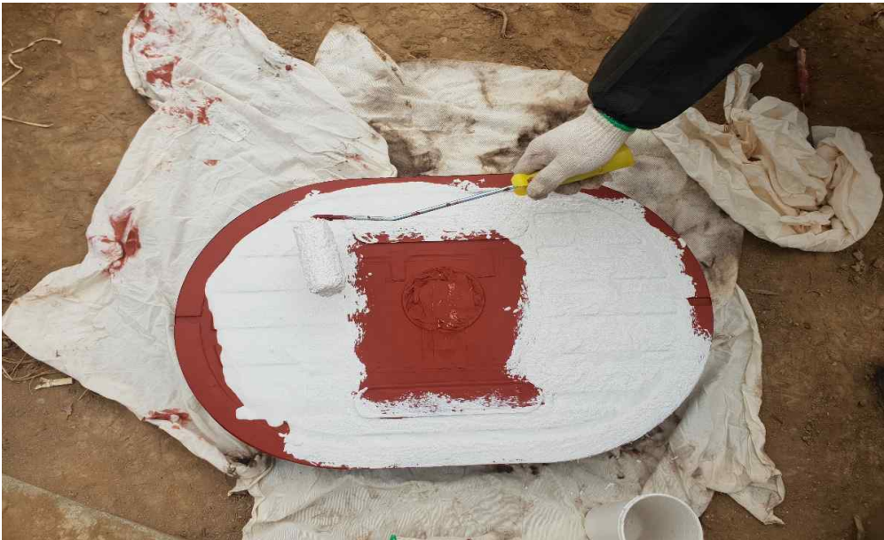
상수도 계량기 맨홀 1차 BASE 도포