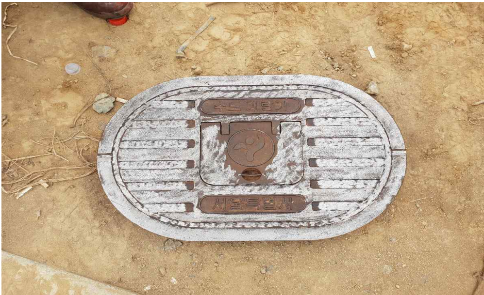
상수도 계량기 맨홀 녹제거 완료