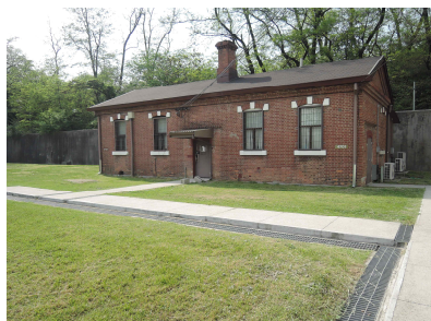
국토부 제안 건물(녹사평대로 변)