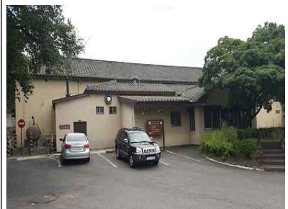
국방부 제안 건물(이태원로 변)