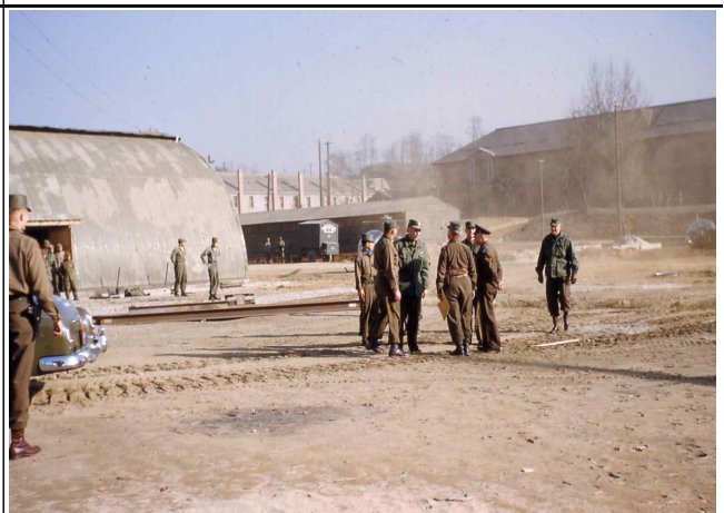
재건 중인 용산 미군기지