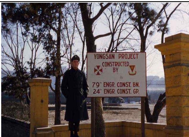
용산기지 건설 프로젝트 수행 기념