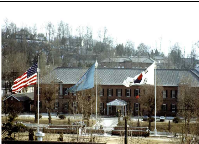
나이트 필드에서 바라본 미8군사령부