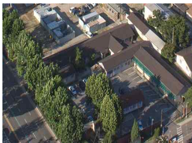
서울시 제안 건물(한강대로 변)