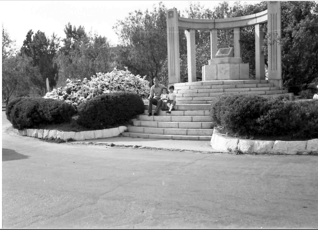
한국전쟁 미8군 전몰자 기념비