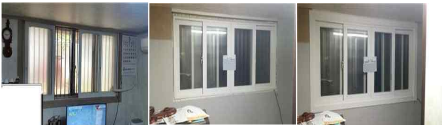
<창짝해체 → 신규틀시공 → 단열폼사춤 → 노출부마감>