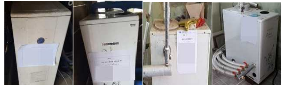
<기존 보일러 확인 → 보일러 철거 → 보일러 교체 설치> (왼쪽부터 가스보일러 시공 전/후, 기름보일러 시공 전/후)

※ 배관(가스, 수도, 난방, 전기, 분배기 등 제반사항이 충족되어 있지 않은 경우 지원 불가