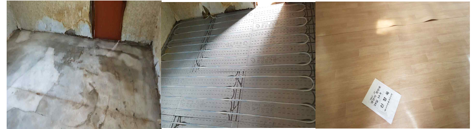
<장판제거 → 바닥판넬 설치 → 보일러 연결 → 장판마무리>

※ 보일러 배관(가스, 수도), 전기, 분배기 등 제반사항이 충족되어 있지 않은 경우 지원 불가하며, 바닥설치 후 보일러와 연결하여 반드시 시운전