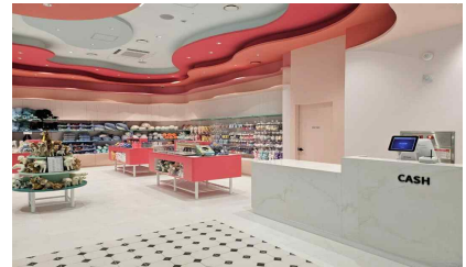
<매표소, 기념품 샵>