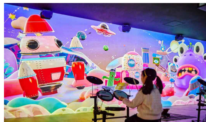
<체험 공간 3층>