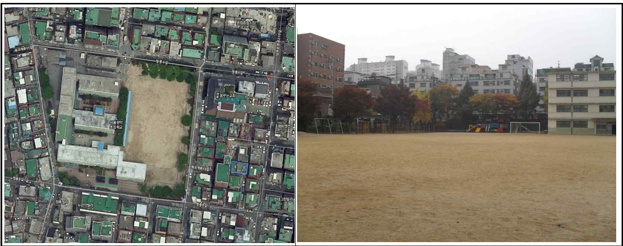
<위치도 및 현장사진>

관악구 관악초등학교 내 설계과정에서 당초계획 대비 생활체육교실 및 다목적체육관 면적이 증가(156.32㎡)하고 부설주차장 14면 증설에 따른 시비 부담액이 증가하여 추경이 편성됨. 공사 중 학생들의 이용 불편을 최소화하도록 빠른 착공을 위해 노력해야할 것임.