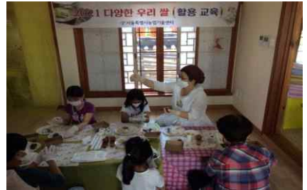
[쌀 이용 음식 실습]