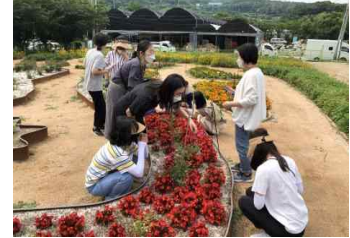
[치유농업 프로그램 운영]