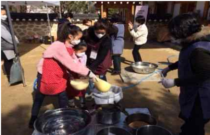
[전통발효식문화 장담그기 체험행사]