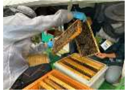
[양봉 전문가 교육]