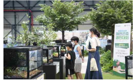
[제5회 대한민국 애완곤충 경진대회]