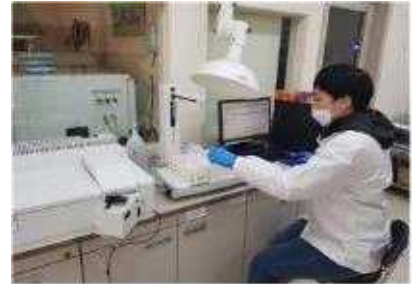
[정밀 토양분석 작업]