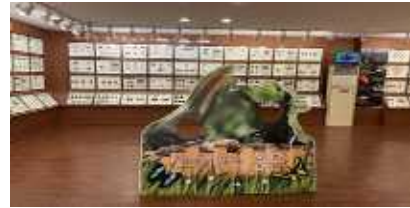
[곤충체험 관련 박물관]