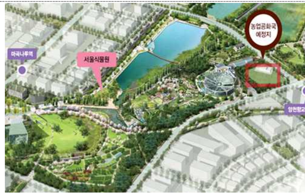
〈 위치도 〉