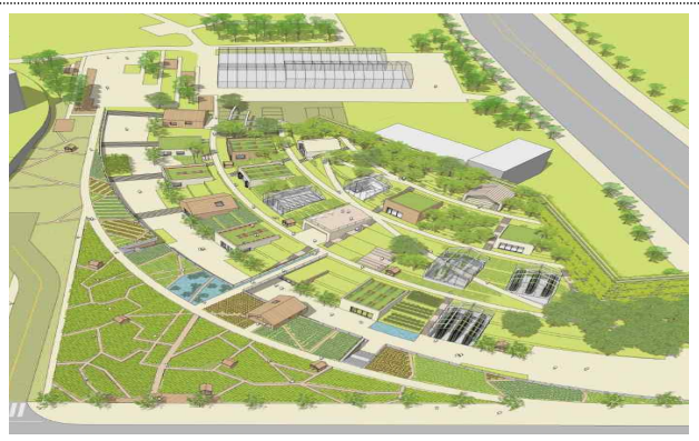
〈 조감도 (현상설계 당선작) 〉