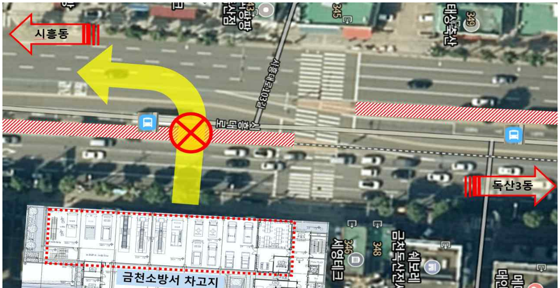
[그림] 금천소방서 출동 현황

청사 앞 시흥대로 보도후퇴를 위해 전신주·통신선로 이설 등의 추가 공사로 예비비 12억 1천만원을 사용한 것임.