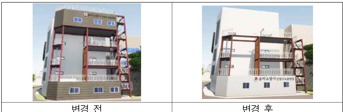
[표] 설계변경 전후의 조감도